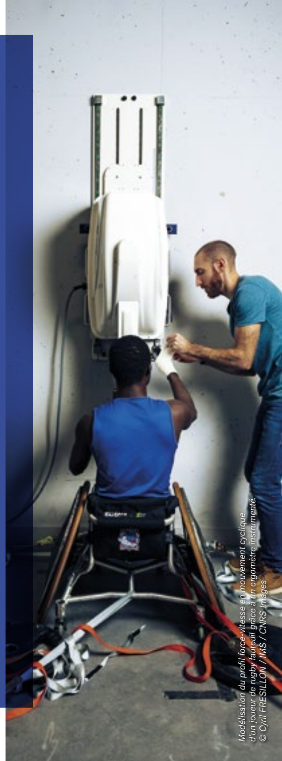
Modélisation du profil force-vitesse en mouvement cyclique d'un joueur de rugby fauteuil grâce à un ergomètre instrumenté.