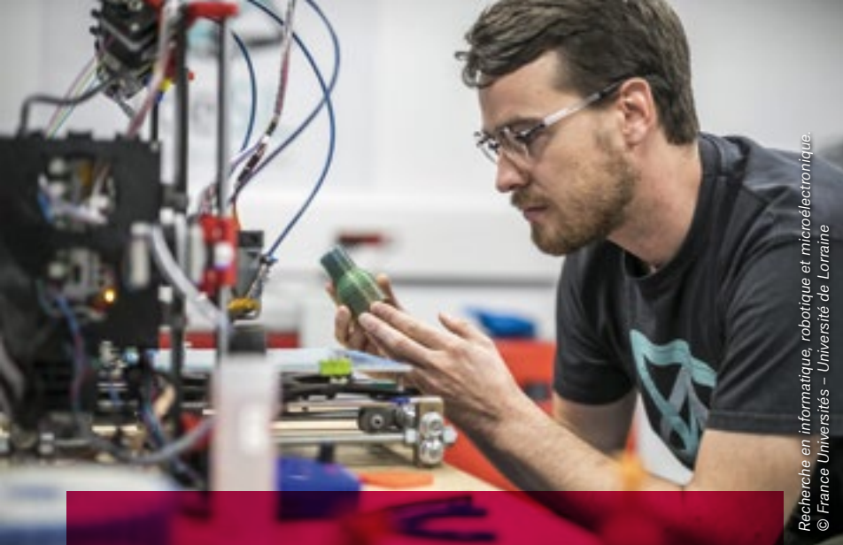
Recherche en informatique, robotique et microélectronique.