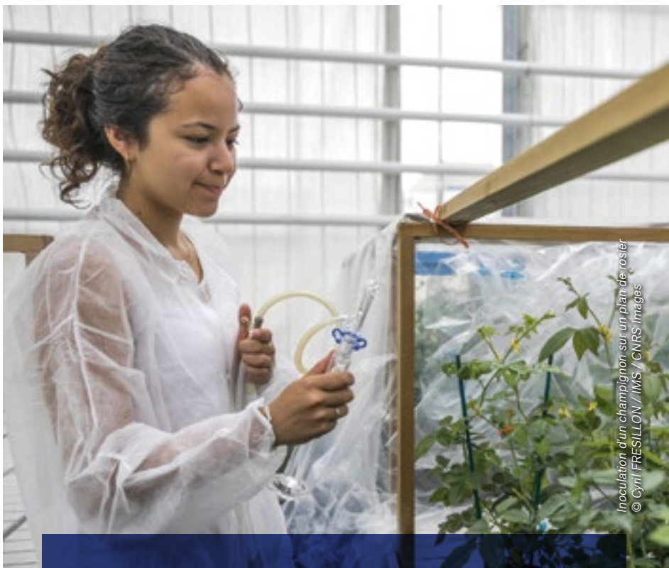
Inoculation d'un champignon sur un plan de rosier

Dans des disciplines telles que les Sciences politiques , les Sciences économiques et de gestion , le Droit , le Commerce , le Management et la Communication et le Marketing , ce sera au cas par cas.